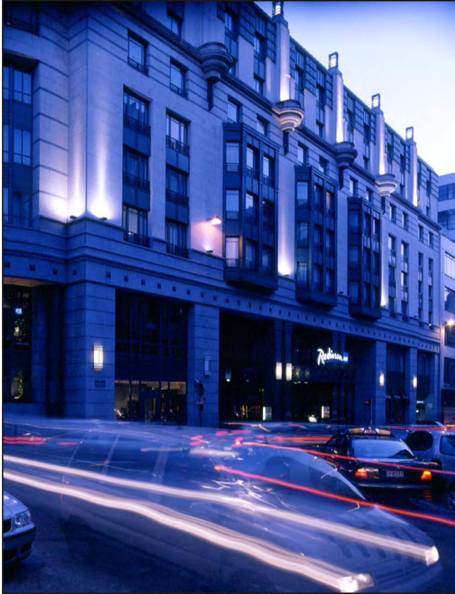
08 Hôtel Radisson's (Bruxelles)