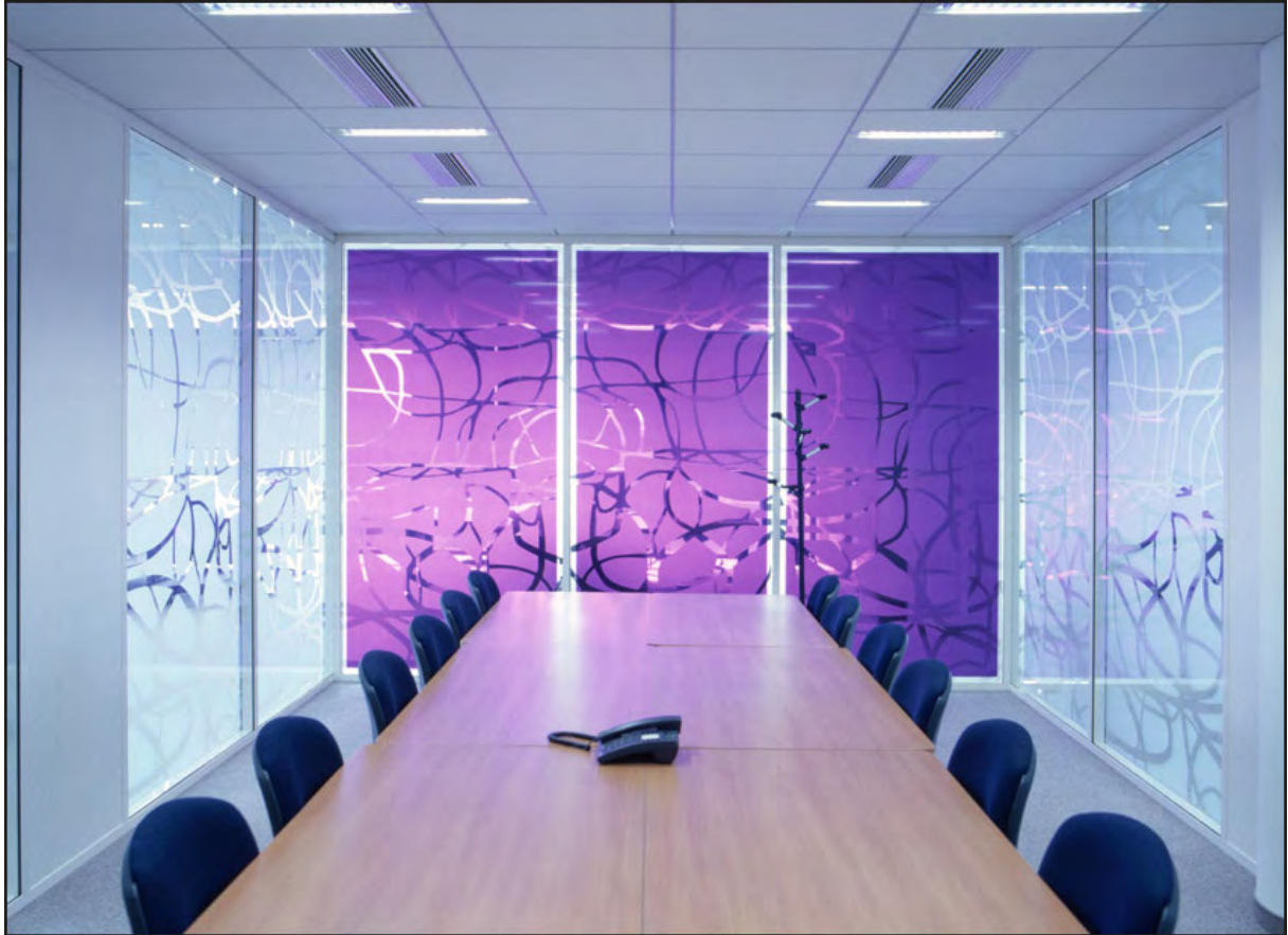
15 Immeuble Equinox, Clichy (Hauts-de-Seine)