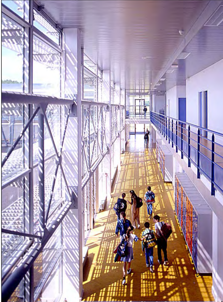
16 Collège, Paron (Yonne)