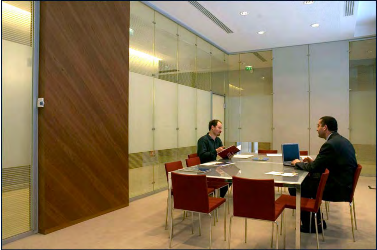
14 Immeuble Eurostade, Saint-Denis (Seine-Saint-Denis)