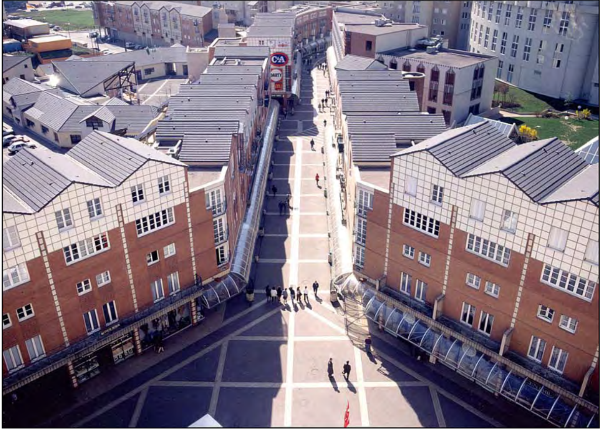
17 Immeubles d'habitation, Saint-Quentin-en-Yvelines (Yvelines)