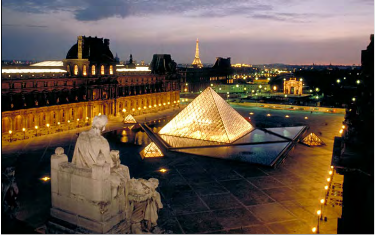
19 Paris, le Louvre, vue des toits à l'angle du pavillon Sully (crépuscule)