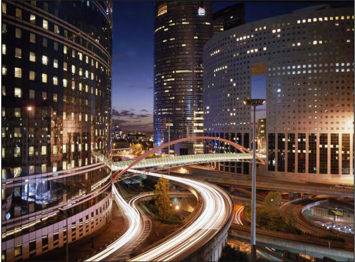
01 La Défense (Hauts-de-Seine)