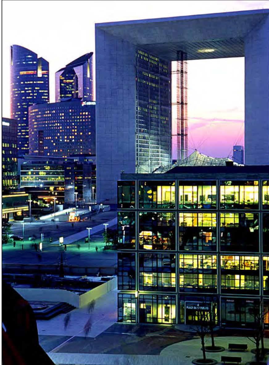
03 La Défense, Maison de la Défense et Grande Arche (Hauts-de-Seine)