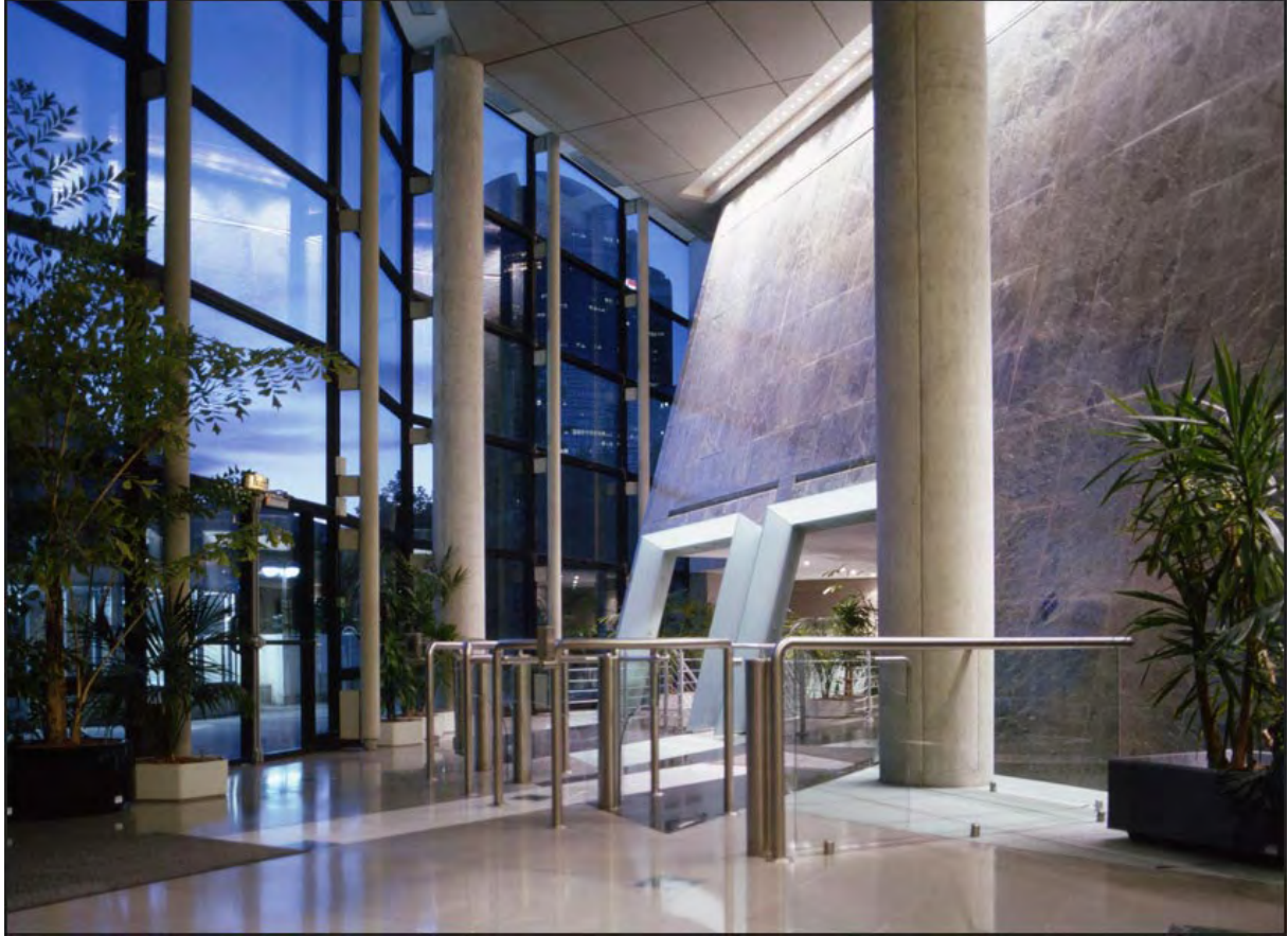
09 Immeuble le Cap, Puteaux (Hauts-de-Seine)