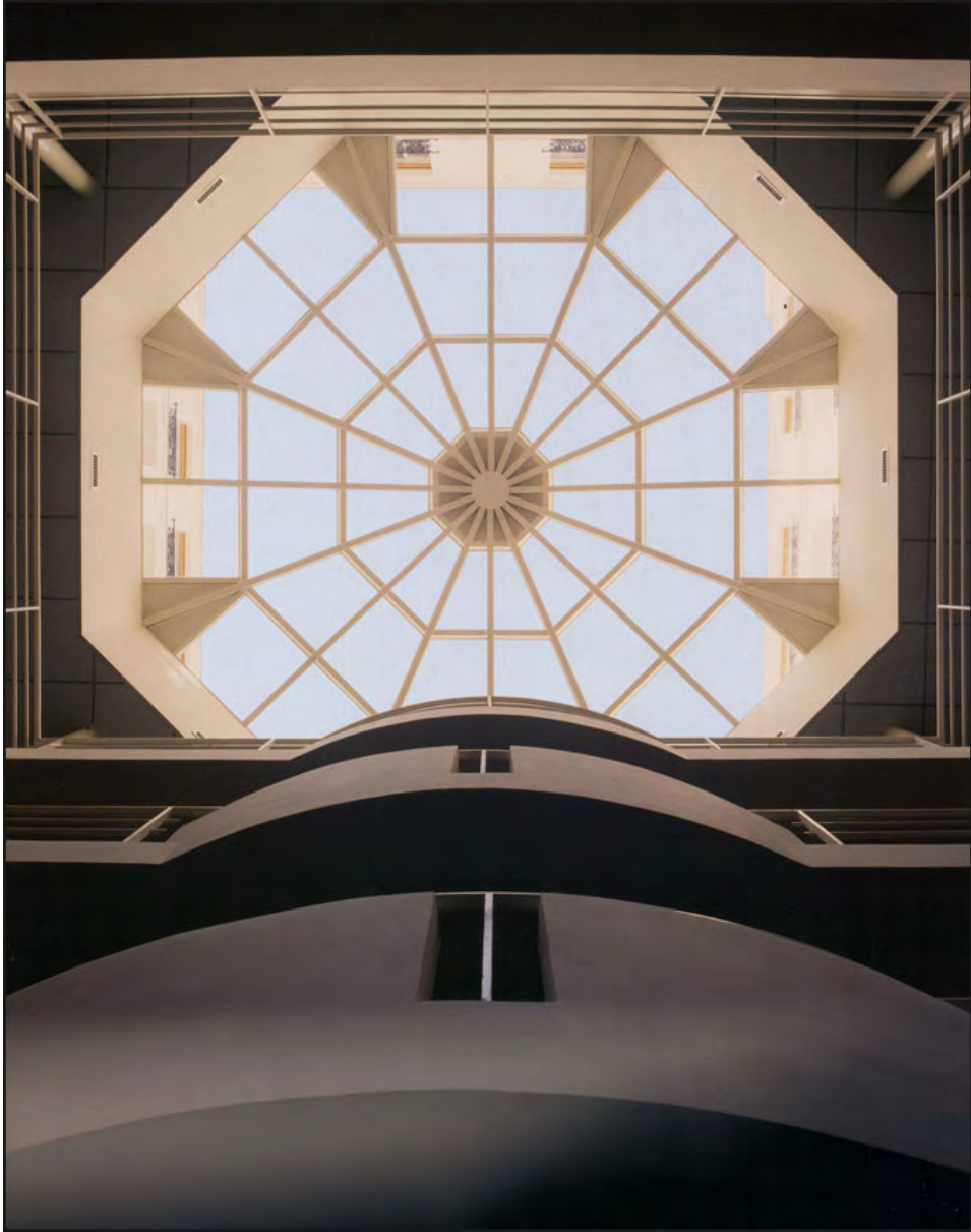
04 Immeuble, rue Roquépine (Paris)