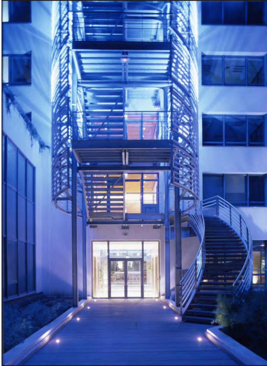
13 Immeuble le Gaynard, Marseille (Bouches-du-Rhône)