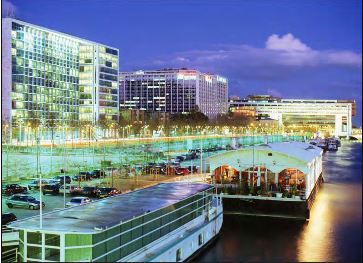
10 Immeuble Central Seine, quai de la Rapée (Paris)