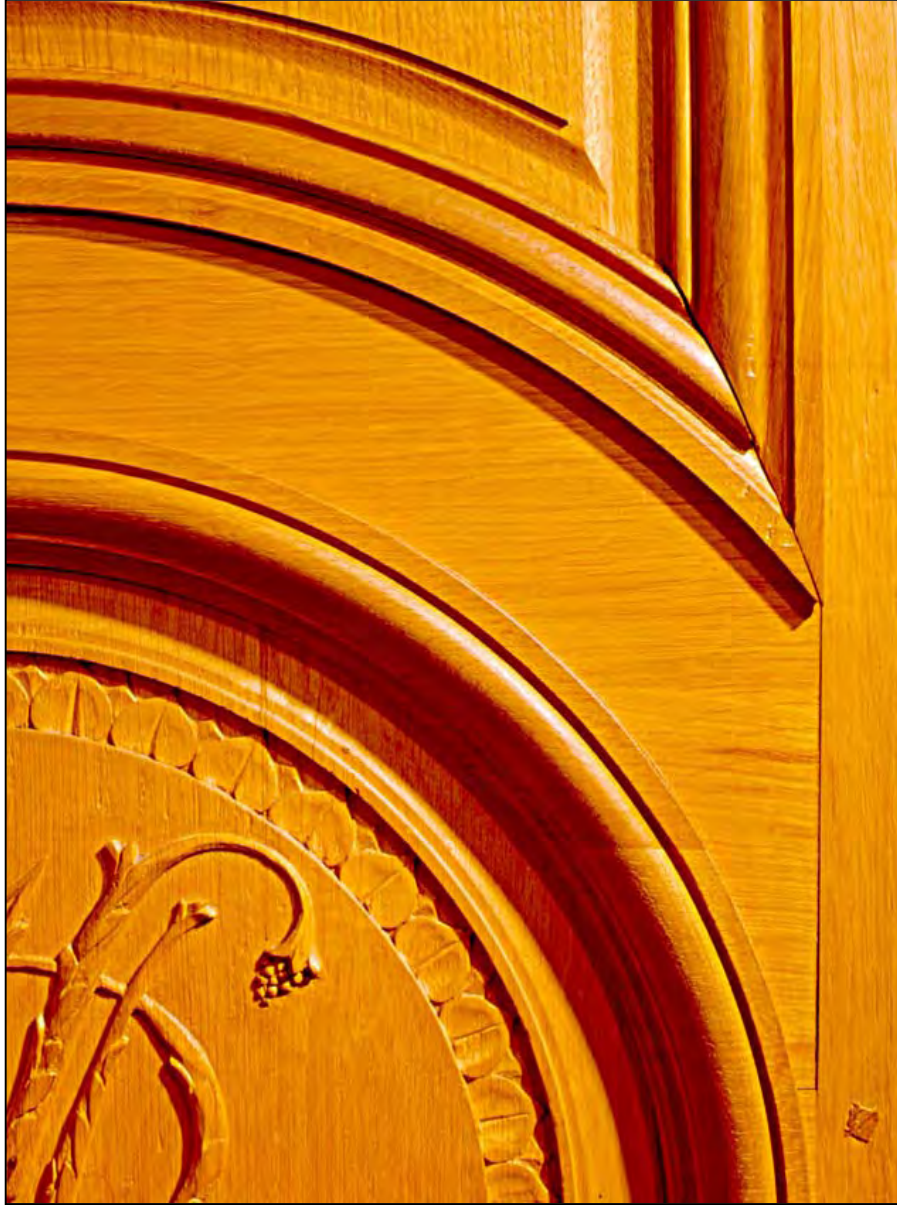
07 Immeuble, rue de la Banque, porte sculptée (Paris)