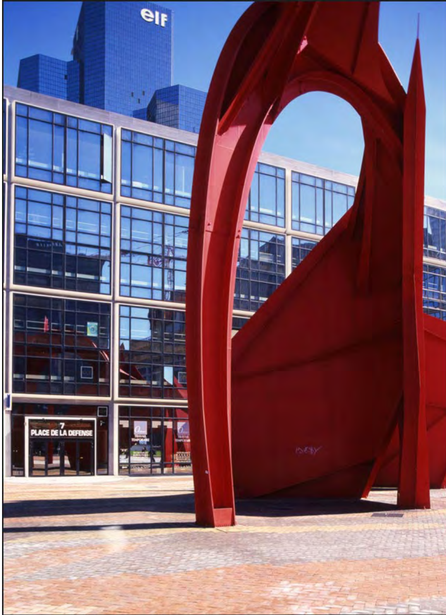
02 Maison de la Défense (Hauts-de-Seine)