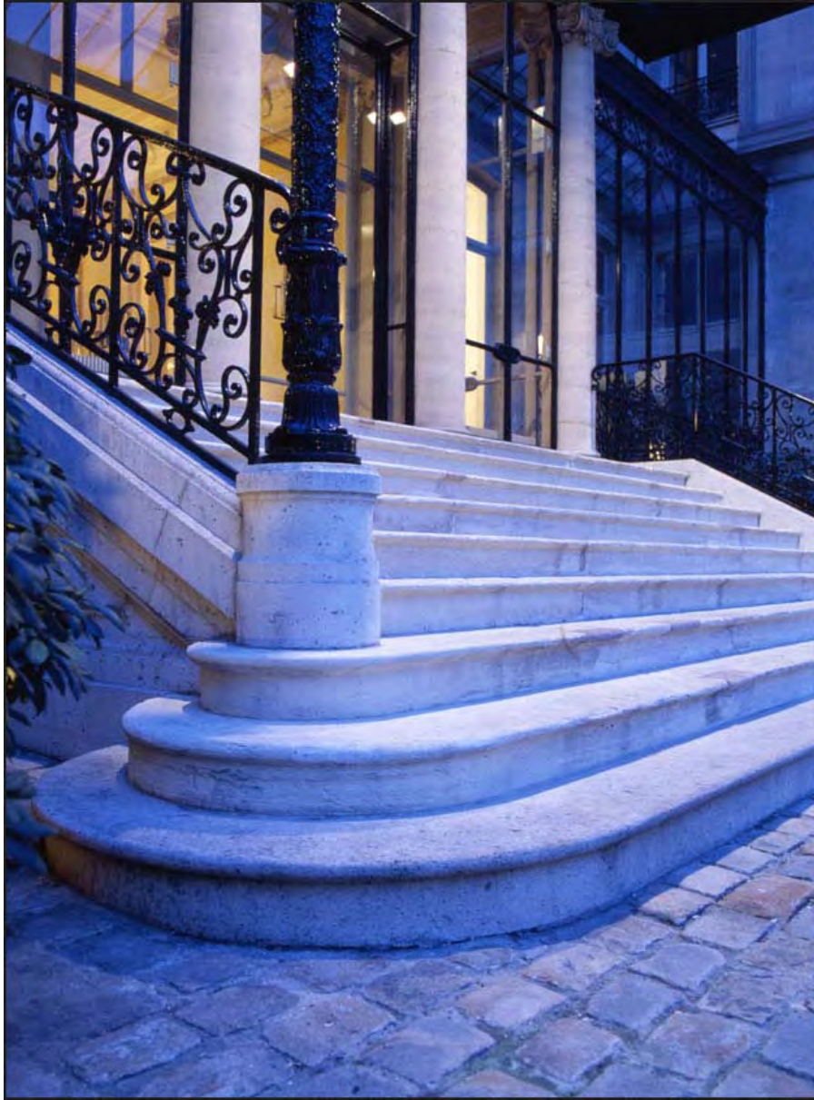
06 Hôtel particulier, faubourg Saint-Honoré (Paris)