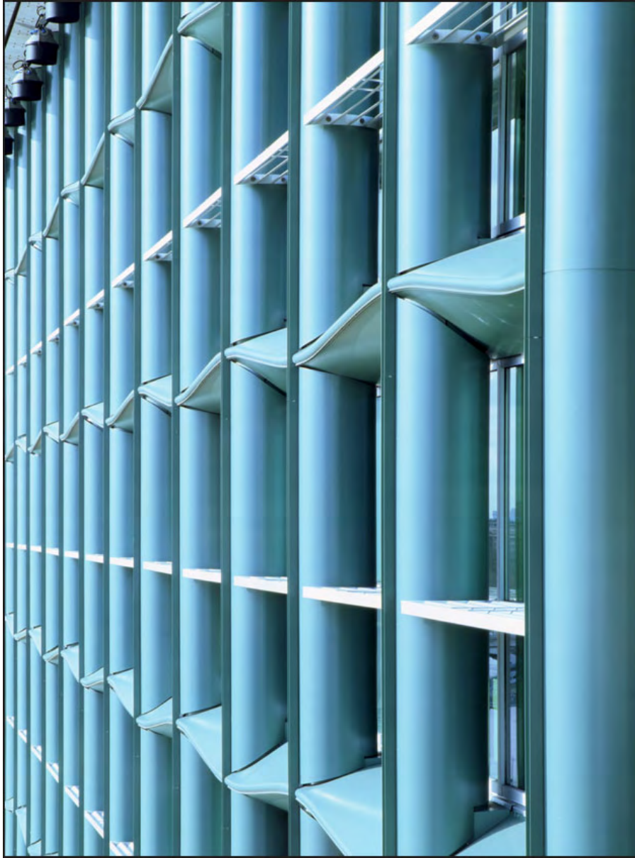
11 Immeuble Central Seine, quai de la Rapée (Paris)