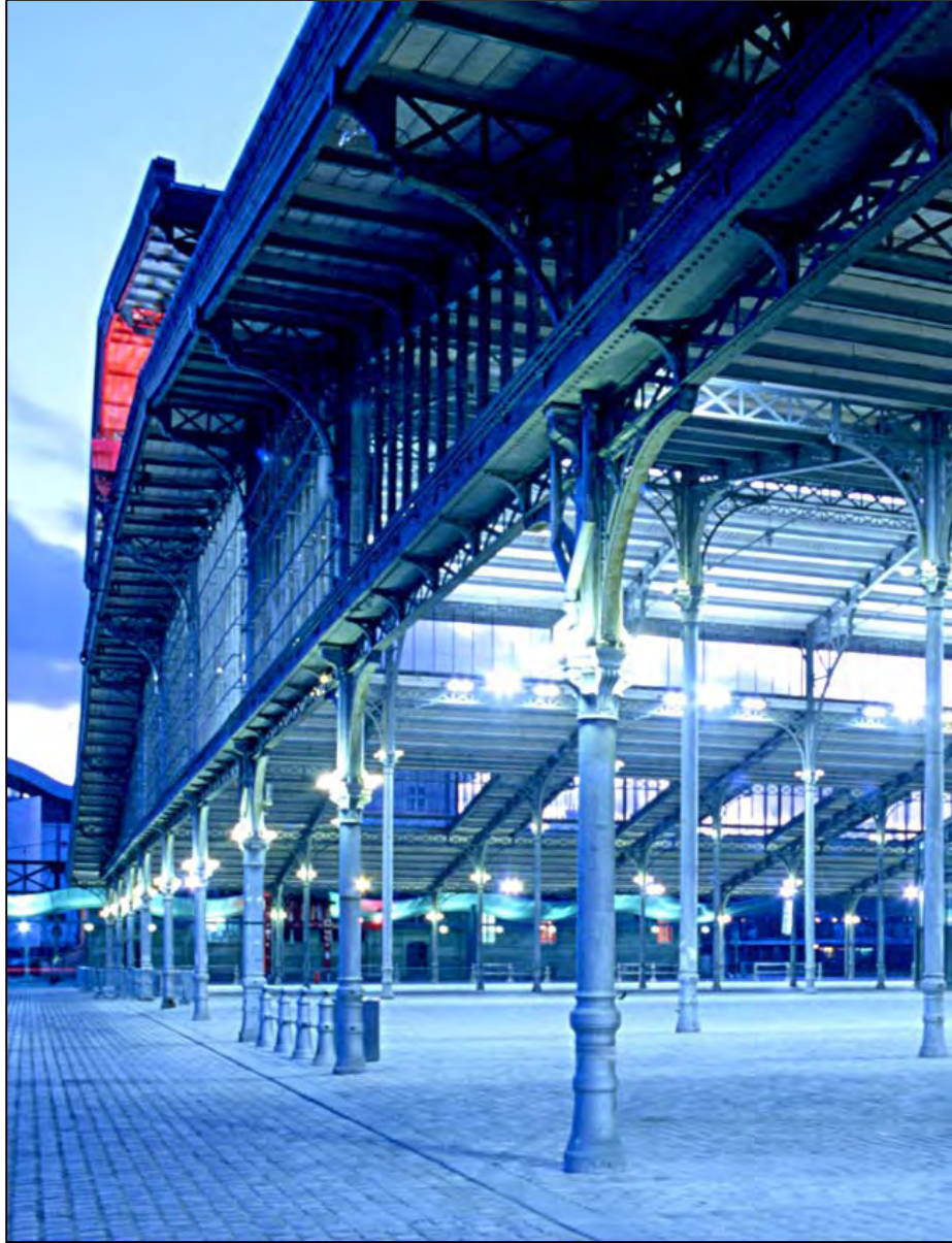
20 Paris, parc de la Villette, Grande Halle (crépuscule)