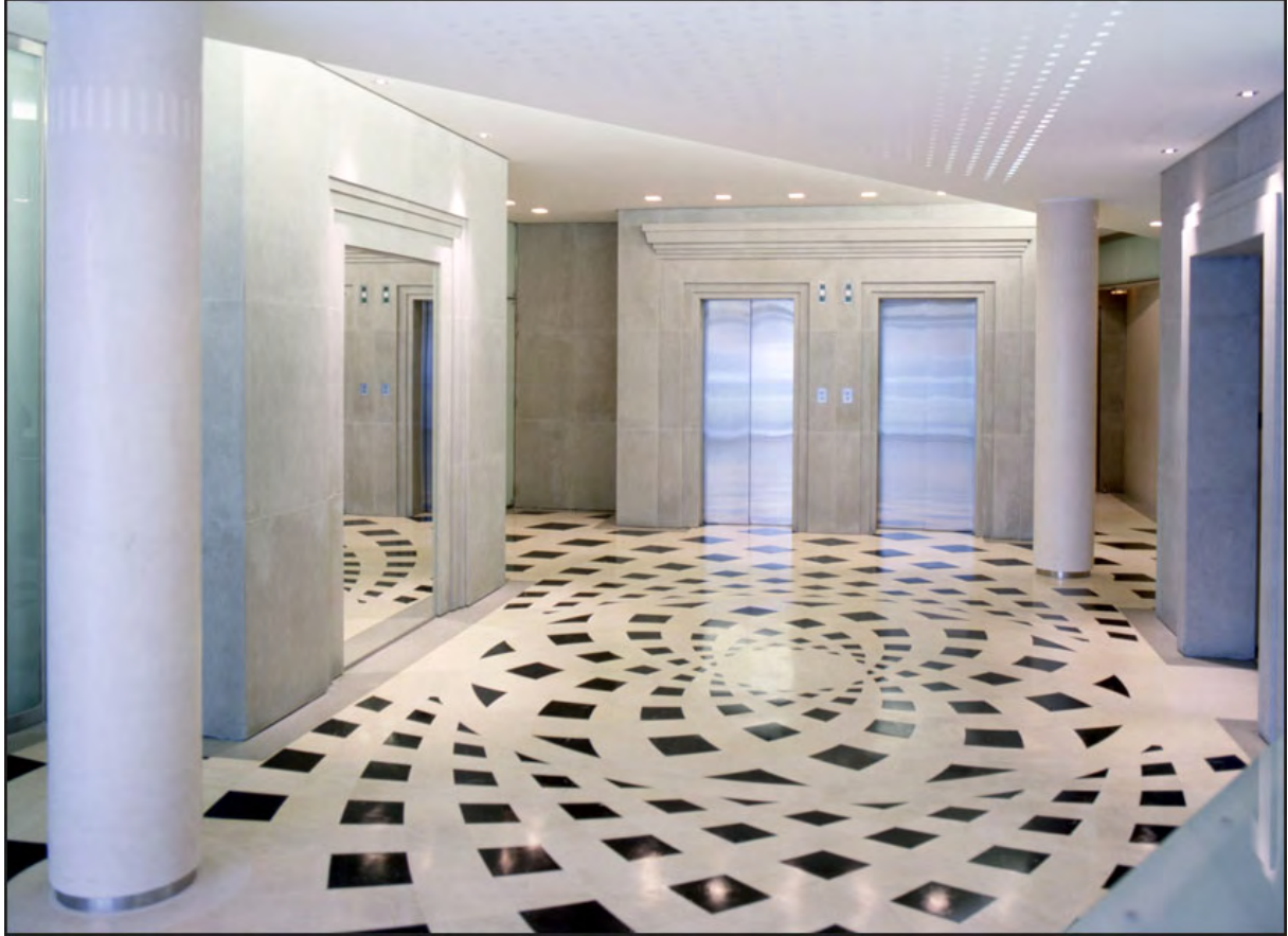
05 Immeuble, rue des Colonnes (Paris)