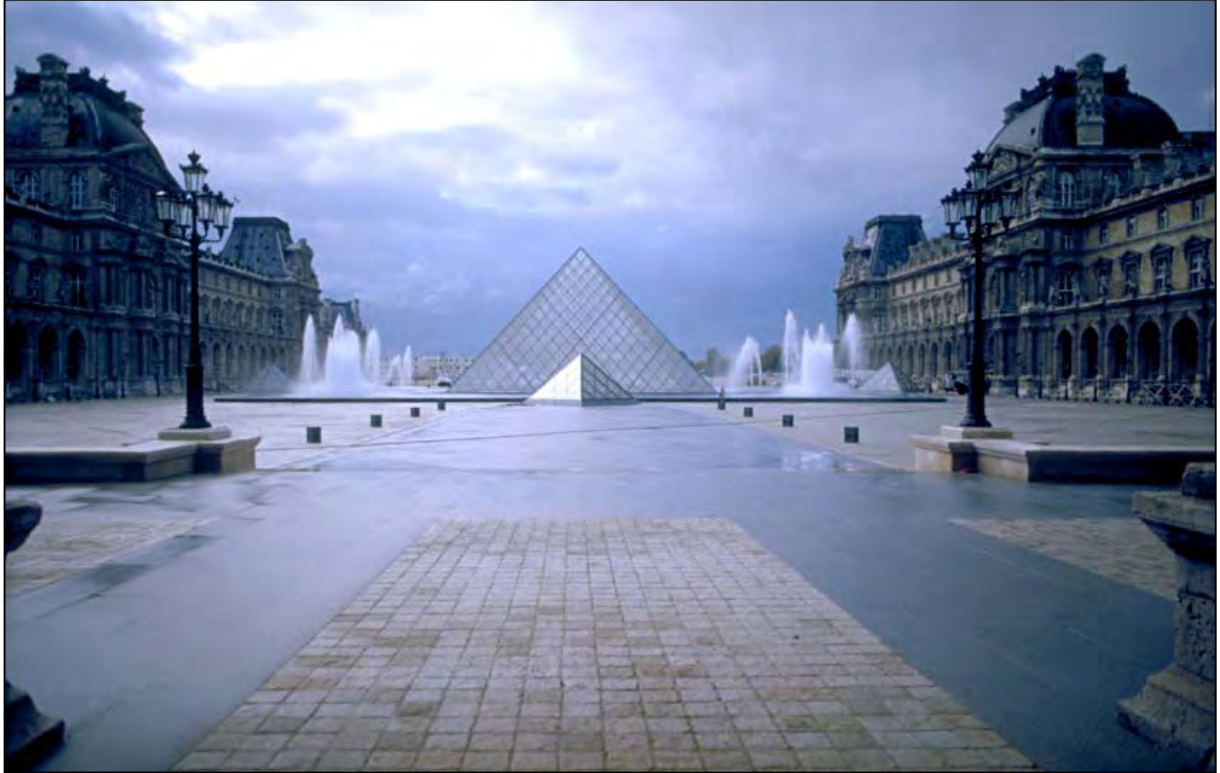
18 Paris, le Louvre, cour Napoléon